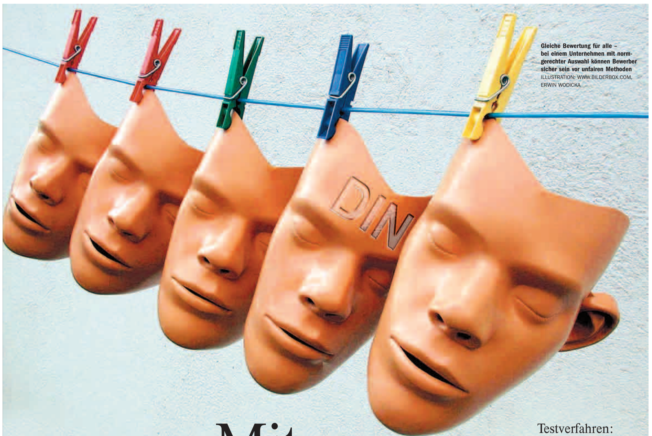
Gleiche Bewertung für alle – bei einem Unternehmen mit normgerechter Auswahl können Bewerber sicher sein vor unfairen Methoden ILLUSTRATION: WWW.BILDERBOX.COM, ERWIN WODICKA

Eine Veröffentlichung der Redaktion Sondertemen für die WELT Redaktionsleiterin: Astrid Gmeinski-Walter Redaktion: Barbara Schröter, Dr. Anke-Sophie Meyer Anzeigen: Michael Witzke (verantwortlich) Lore Kalamala (Aus- und Weiterbildung), Ismail Kara (Stellenanzeigen) Layout: Elke Kaufmann www.karrierewelt.de